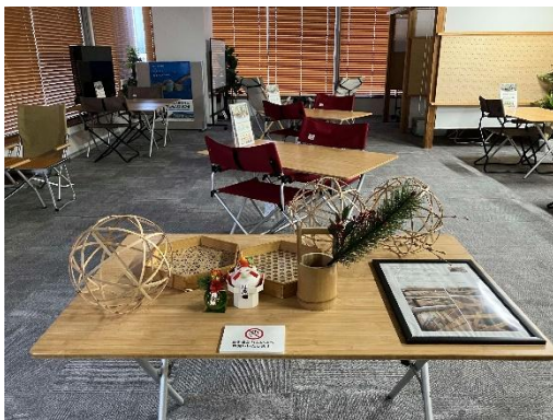
（県内事業者による商品展示）