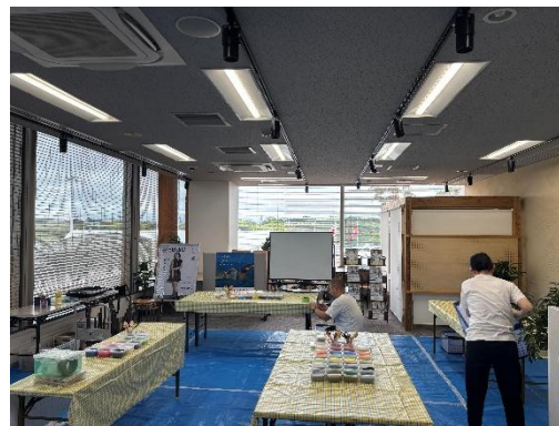
（イベント・セミナー活用）