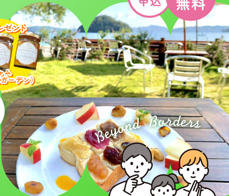
ジャムズガーデン(周防大島)